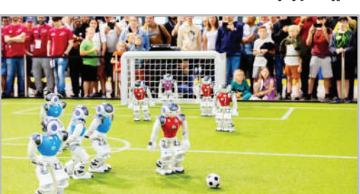
جام جهانی فوتبال رباتیک - هلند