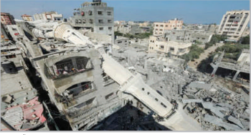
ریختن مناره مسجد عید... اعظم در اثر حمله هوایی اسرائیل به اردوگاه آوارگان