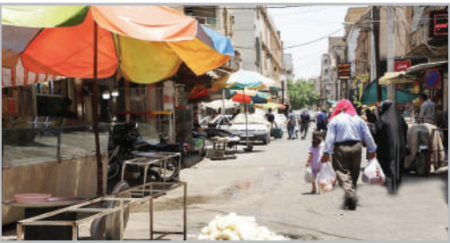
امواز گرم‌ترین شهر جهان