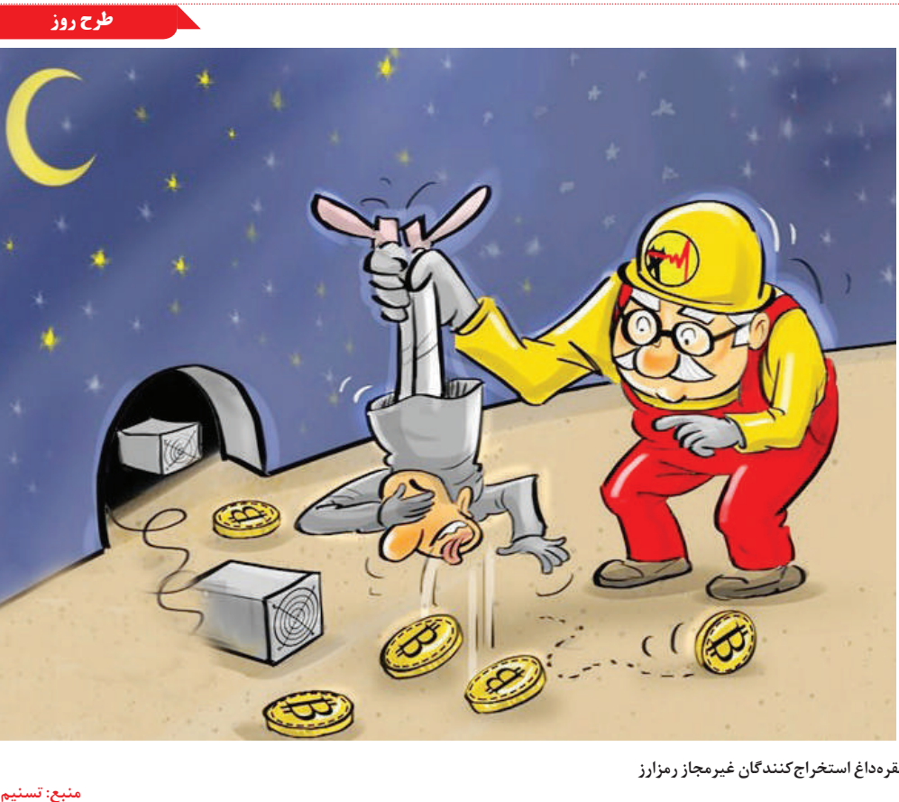
نقره‌داغ استخراج‌کنندگان غیرمجاز رمز ارز