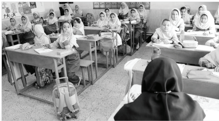
تأسیسات مدرسه در شهر شیراز

استان گفت: خانواده‌ها دغدغه و نگرانی نداشته باشند؛ چراکه با اقدامات انجام شده امسال هیچ کمبود معلمی در استان نخواهیم داشت و معلمان در سال تحصیلی به موقع سرکلاس می‌روند. مدیرکل آموزش و پرورش استان فارس اظهار کرد: امسال در یک برد جمعی