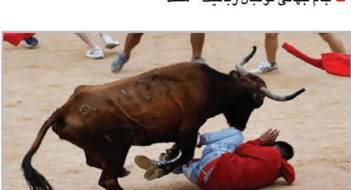
جشنواره گلابازی سان فرمین در پامپلونا - اسپانیا