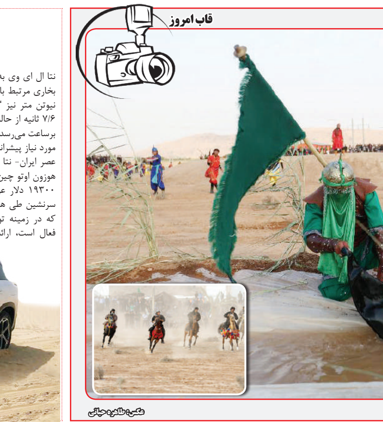
بزرگ‌ترین تفریح میدانی در صحراورد - فسا

طور منظم مایعات بنوشید و از مصرف نوشیدنی‌های شیرین خودداری کنید. خانه‌های خود را خنک نگه دارید. در طول روز پنجره‌ها را ببندید و در صورت تابش آفتاب به داخل منزل کرکره‌ها را پایین بکشید. در شب، هنگامی که درجه حرارت محیط بیرون کاهش می‌یابد پنجره‌ها را باز کنید، اگر در محل زندگی شما دستگاه تهویه هوا روشن است، درها و پنجره‌ها را ببندید. بر اساس توصیه سازمان جهانی بهداشت، پنکه‌های برقی ممکن است کمی در فرار از گرما کمک کنند باشد، ولی در درجه حرارت بالاتر از ۳۵ درجه سانتی‌گراد ممکن است در پیشگیری از گرم‌زدگی خیلی مفید نباشد. در این حالت مصرف مایعات اهمیت زیادی دارد. خود را دور از گرما نگه دارید. در خنک‌ترین اتاق خانه (به ویژه در هنگام شب) اقامت کنید. از رفتن به محیط بیرون در طول گرم‌ترین ساعات روز خودداری کرده، بدن را خنک نگه دارید و آب‌رسانی کنید. دوش یا حمام آب سرد بگیرید یا به جای حمام یا دوش آب سرد می‌توان از کیسه آب سرد یا حوله یا اسفنج حاوی آب سرد و شست‌وشوی